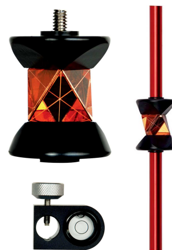
ADS 360 mini