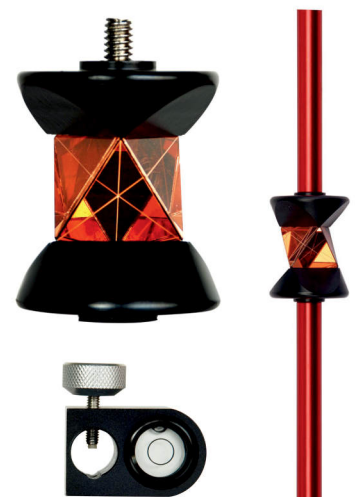
ADS 360 mini